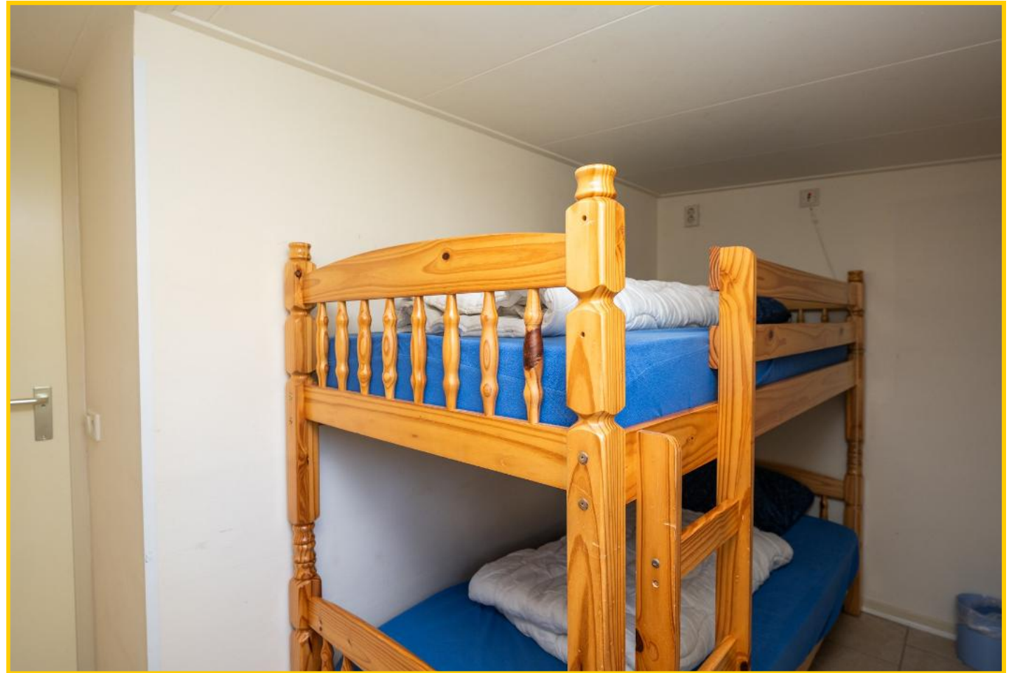
In de derde slaapkamer staat een solide stapelbed.