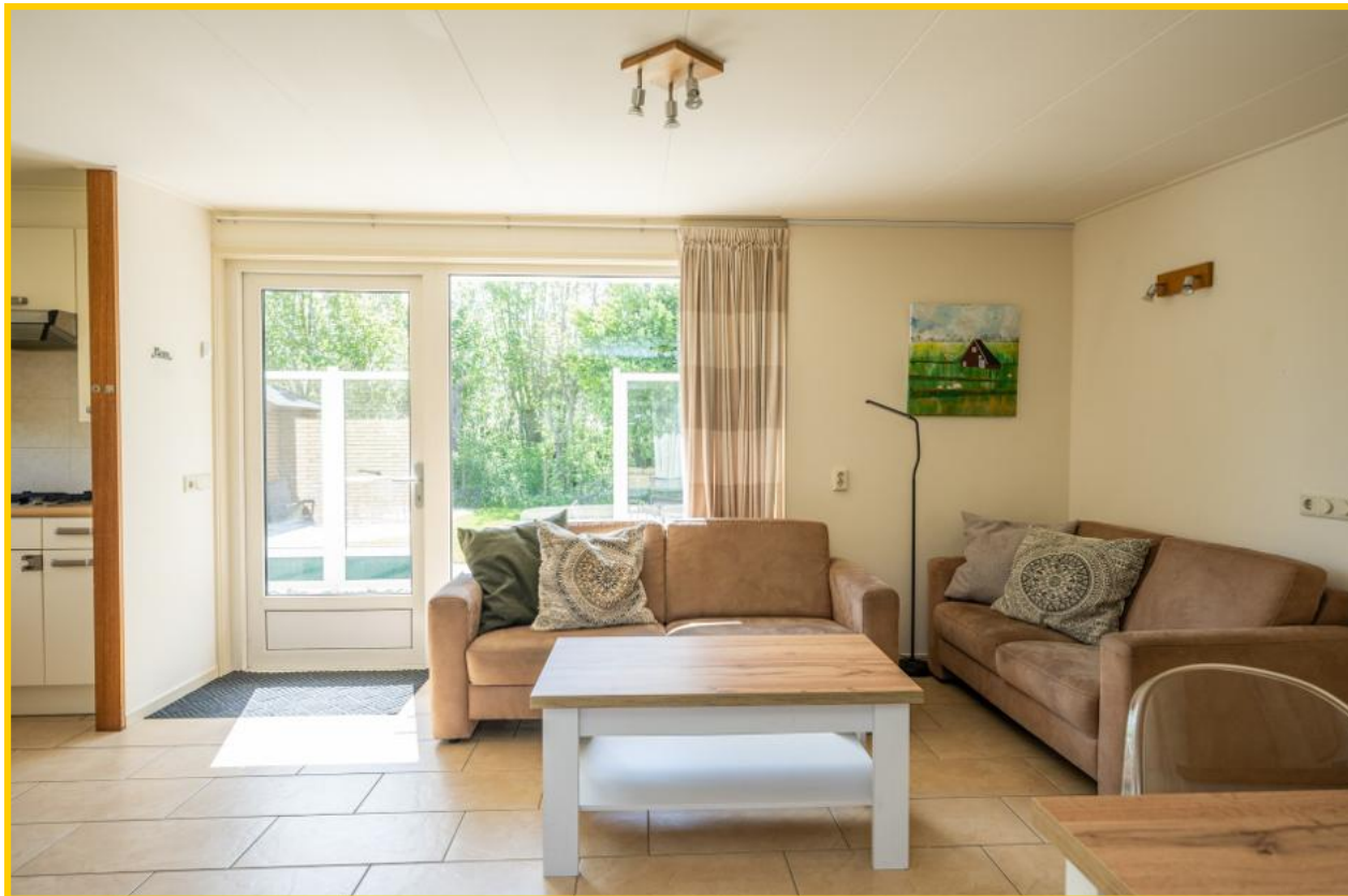
De woonkamer vormt het hart van de woning.