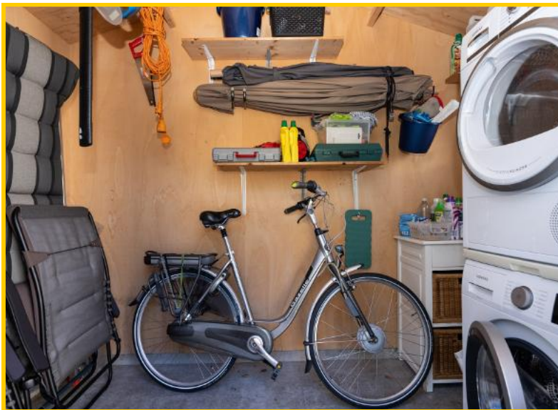
In de buitenberging een wasmachine (2022) en een warmtepompdroger (2020) beiden van het merk Siemens.